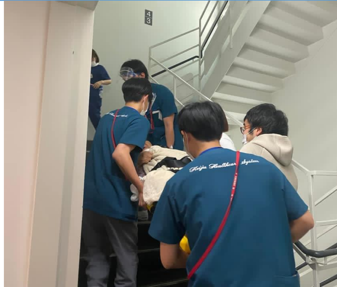
3病棟・5病棟患者 エレベーター停止の中 総員退避